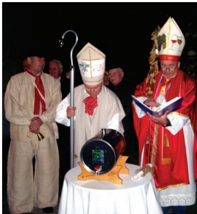
Krštenje vina za Martinje u Ščitarjevu (2014.)